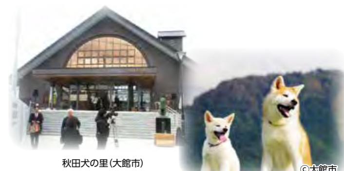
秋田犬の里 (大館市)

大館市の観光施策アドバイザーとして、秋田犬に関する国際的人気の調査や、広報・宣伝活動に協力しています。