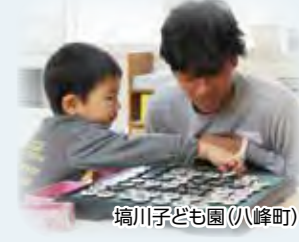
埴川子ども園(八峰町)