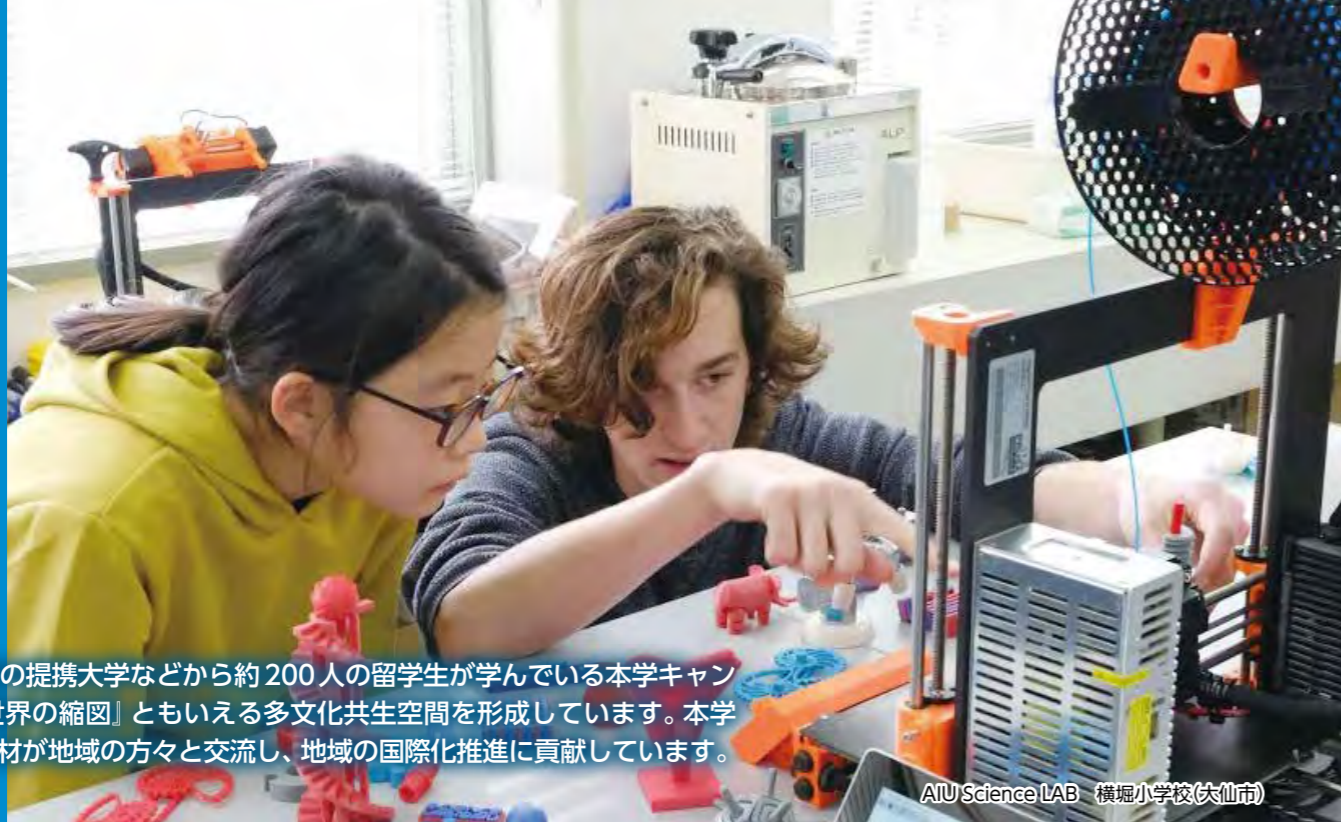
AIU Science LAB 横堀小学校(大仙市)

200の海外の提携大学などから約200人の留学生が学んでいる本学キャンパスは、『世界の縮図』ともいえる多文化共生空間を形成しています。本学の多様な人材が地域の方々と交流し、地域の国際化推進に貢献しています。