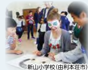
新山小学校(由利本荘市)