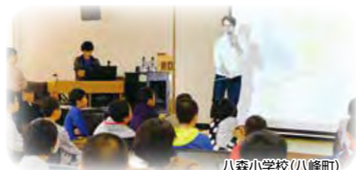
八森小学校(八峰町)

小学生と英語で歌を歌ったり、世界地図で国の英語名と場所を確認しました。留学生にとっては、子どもに対する話し方や教え方の練習になりました。