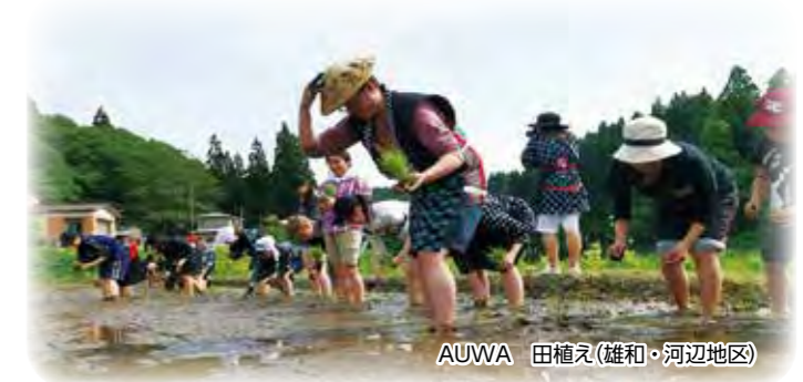
AUWA 田植え(雄和・河辺地区)

(AUWA/会う輪代表学生より) AUWA/会う輪は、主に本学周辺の雄和・河辺地区の方々と本学学生の交流を増やし、ご近所さんのような関係を築くことを目的に活動しています。畑や田んぼの仕事・体験に加え、様々なイベントで英語を使って(メンバーの約半数は留学生です)子どもや保護者の方々と交流したり、おじいちゃんおばあちゃんたちと「お茶っこ」したりなど、いろいろな活動をしています。これからも地域貢献活動を続け、また何か新しいことにも挑戦していきたいと考えています。