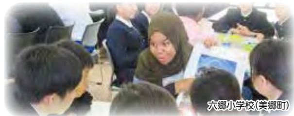
六郷小学校(美郷町)

県内協定市町村等との間で、学校などの異文化交流事業や外国語活動への本学留学生の派遣や、小中高校生による本学訪問の受入を通じた交流活動等を実施しています。