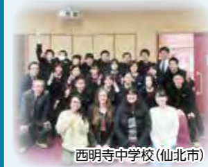
西明寺中学校(仙北市)