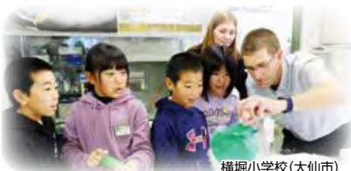
横堀小学校(大仙市)

本学留学生が日本語や日本文化を学ぶ日本語プログラムでは、授業に小学生を招き、日本語学習と地域交流を合体させ、相乗効果を生み出しています。