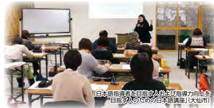
「日本語指導者を目指す人および指導力向上を目指す人のための日本語講座」(大仙市)