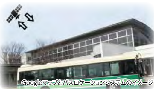
Googleマップとバスロケーションシステムのイメージ