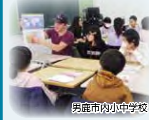
男鹿市内小中学校