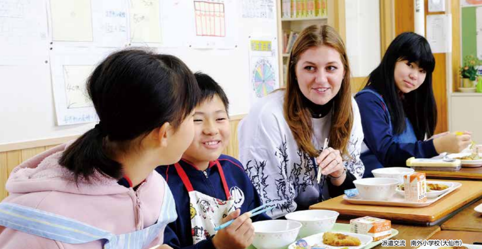
派遣交流 南外小学校(大仙市)