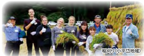
稲刈り(小平岱地域)

本学の所在地である秋田市雄和地区をはじめ、県内各地域の方々や伝統行事や各種イベントを通じた継続的な交流を行っています。