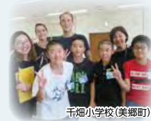
千畑小学校(美郷町)