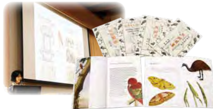
公開講座「世界の中の秋田蘭画」

世界に目を向けた進取の気性を示す「秋田蘭画」の小冊子出版とともに、講演等を通して国内外への積極的な紹介を続けています。